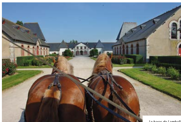
Le haras de Lamballe

Rendez-vous sur le site internet du Syndicat mixte du Haras www.haras-lamballe.com ou envoyez vos idées à contact@haraspatrimoine.com .