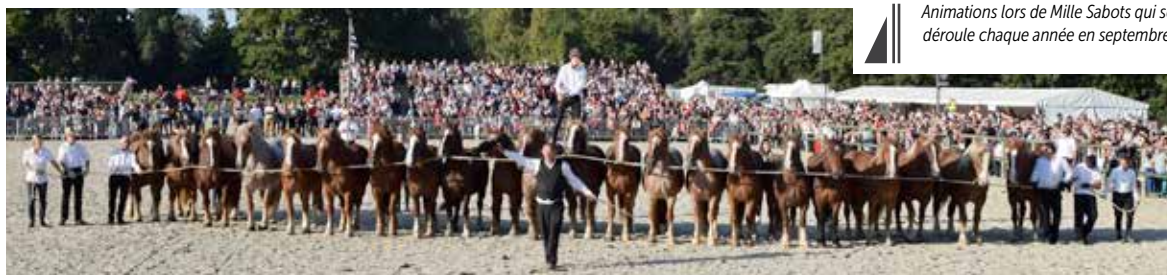
Animations lors de Mille Sabots qui se déroule chaque année en septembre.