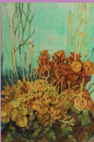
Crédit photo Mathurin Méheut, Himanthales, collection particulière. © ADAGP, Paris 2018. Photographie : Procolor

Jusqu'au 29 décembre Exposition « Vues sur mer » Musée Mathurin Méheut Place du Martray - Lamballe